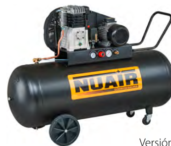
Versión 200 lts.