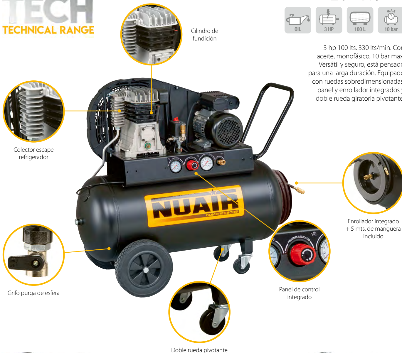
Cilindro de fundición