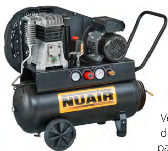
Versión 30 y 50 lts. con dos apoyos delanteros para mayor estabilidad.